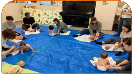
8組参加 パパ2人緊張気味です