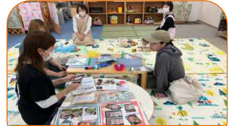
2組参加 素敵なアルバムに！