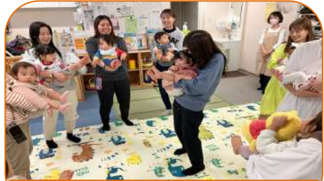
10組参加 ぎゅっと安全抱っこ